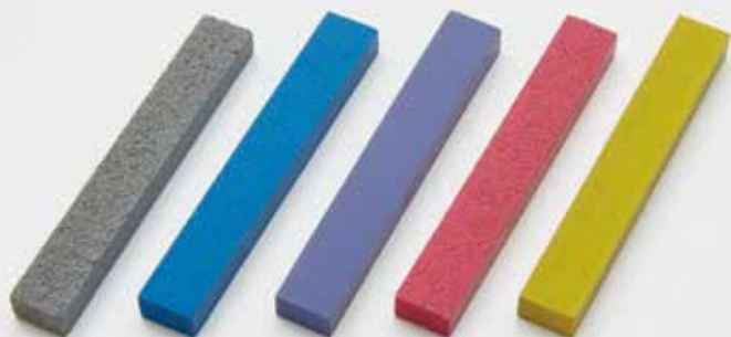
スティック砥石 70×10×6mm厚